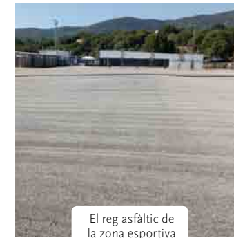
El reg asfàltic de la zona esportiva

El gener d'aquest any l'Ajuntament de Porqueres va signar un conveni de col·laboració amb la Diputació de Girona per a l'execució d'obres de tractament superficial asfàltic de l'aparcament i del camí de la zona esportiva, carrer Garrotxa i Empordà i Camí de Cal Ferrer a Mas Badosa. Aquestes obres han estat executades el mes d'agost passat i han consistit en l'arranjament del ferm per part de l'ajuntament i la realització del reg asfàltic a càrrec de la Diputació.